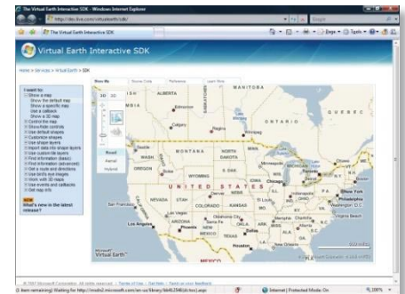
Набор SDK Virtual Earth

Используйте библиотеку геометрии на базе .NET, соответствующую стандартам OGC. Создавайте приложения, использующие пространственные данные и управляющие ими. Интеграция с геопространственными службами, такими как Microsoft Virtual Earth™, обеспечивает создание полнофункциональных решений с пространственными возможностями.